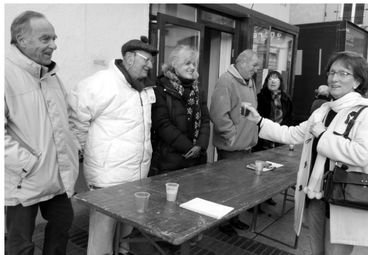
Toujours autant d'enthousiasme autour de l'amitié franco-allemande.