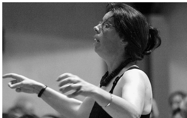
L'événement phare du Conservatoire, c'est maintenant, avec 160 intervenants sur scène.